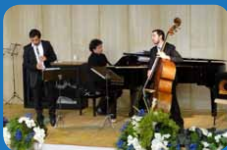
Il concerto organizzato in occasione del 60° anniversario del Bazoli