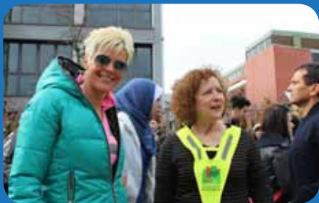
Durante la maratonina d'istituto la Dirigente incontra la campionessa di mountain bike veronese Paola Pezzo