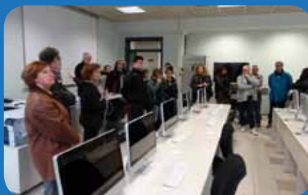
L'inaugurazione del nuovo laboratorio MAC LI

L'istituto augura agli studenti e alle loro famiglie serene vacanze e una buona estate