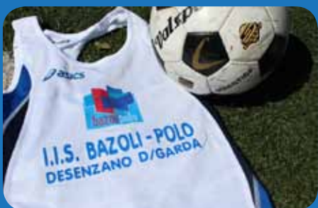
La maglia dei campionati provinciali di calcio