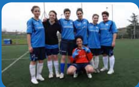
La nostra squadra di calcio al campionato a 5 femminile